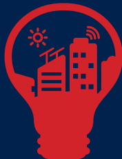
Anugerah Terbaik Inisiatif Bandar Pintar