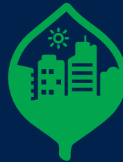
Anugerah Terbaik Inisiatif Bandar Hijau