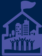
Anugerah Terbaik Inisiatif Bandar Sejahtera