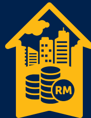
Anugerah Terbaik Inisiatif Bandar Makmur