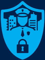
Anugerah Terbaik Inisiatif Bandar Selamat