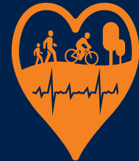
Anugerah Terbaik Inisiatif Bandar Sihat