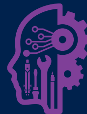
Anugerah Terbaik Inisiatif Kreatif dan Inovatif