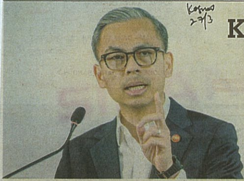
FAHMI bercakap pada sidang akhbar pasca mesyuarat Kabinet di Putrajaya semalam.