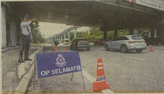
OP Selamat 24 sempena Hari Raya Aidilfitri akan mula dikuatkuasakan bermula 29 Mac hingga 3 April ini.

BANGI – Sebanyak 554 lokasi di lebuhraya serta jalan Persekutuan seluruh negara yang berisiko tinggi berlaku kesesakan dan kemalangan telah dikenal pasti menerusi Op Selamat 24 sempena Hari Raya Aidilfitri.