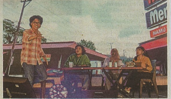
One of the theatrical performance during the anniversary dinner.

Guests were treated to two theatrical performances, including one that reflected on MBI Selangor's 30-year journey and celebrated its growth, achievements and contributions to Selangor.