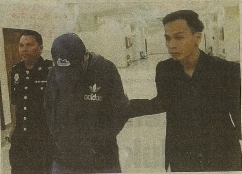
Tertuduh (tengah) diiringi pegawai SPRM keluar dari mahkamah selepas mengaku salah atas dua tuduhan rasuah di Mahkamah Sesyen Kuantan.

Tertuduh didakwa menerima suapan RM300 secara berasingan di sebuah cawangan bank di Jalan