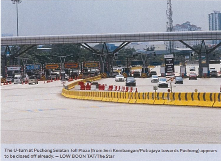
The U-turn at Puchong Selatan Toll Plaza (from Seri Kembangan/Putrajaya towards Puchong) appears to be closed off already.