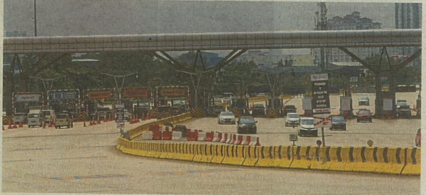
The U-turn at Puchong Selatan Toll Plaza (from Seri Kembangan/Putrajaya towards Puchong) appears to be closed off already. — LOW BOON TAT/The Star

When approached, Littrak declined to comment. — By MEGAT SYAHAR