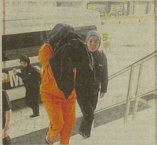
Suspek dibawa ke Mahkamah Majistret Seremban untuk direman.