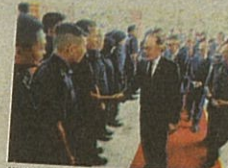
Anwar berinteraksi dengan barisan pegawai polis ketika hadir pada Sambutan Hari Pekerja Hari Pekerja ke-57 di Kuala Lumpur semalam.

"Kita menugaskan seramai 150 anggota untuk bersiap siaga bagi memantau situasi di lokasi tersebut," katanya ketika dihubungi Kosmo! di sini semalam.