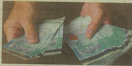
Seramai 4.7 juta penerima STR yang tidak tersenarai dalam eKasih akan menerima bantuan baharu SARA RM50 sebulan bagi warga emas tiada pasangan dan RM100 sebulan untuk isi rumah bermula 1 April ini.

Sementara itu seramai 4.7 juta penerima STR yang tidak tersenarai dalam eKasih akan