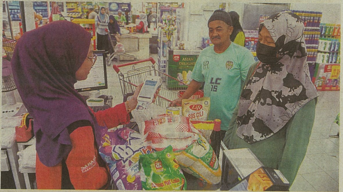
PENERIMA Sara boleh membeli barangan keperluan asas di kedai-kedai runcit terpilih dengan hanya menggunakan MyKad. – GAMBAR HIASAN

"Peluasan penerima merupakan sebahagian daripada peningkatan peruntukan program Sumbangan Tunai Rahmah (STR) dan